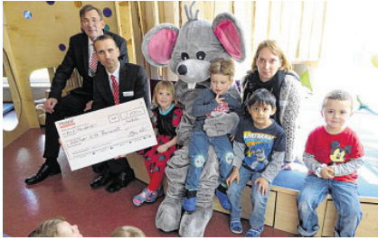
Die HASPA unterstützt die Arbeit der Frühförderstelle mit einer Spende der Peter-Mählmann-Stiftung über 2000 Euro.

Eröffnung der Frühförderstelle der Kita Baumacker